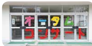
体育館の入り口付近も 楽しげに飾り付けられ ました！

日曜日の午後、地域のみなさんが楽しみにしているオータムコンサートが今年も華やかに開催されました。多くの方が来場し、杉森小PTAコーラスサークル「かえるクラブ」の合唱、三中吹奏楽部の演奏を楽しみました。