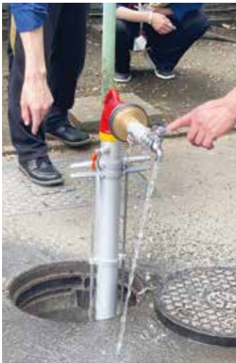
初めて知りました💚 応急給水できる場所

※線状降水帯とは、水蒸気を大量に含んだ空気が狭い範囲に流れ込み発生。線のように並んだ積乱雲がほぼ同じ場所で集中豪雨をもたらす現象。大雨災害が発生する可能性がある。