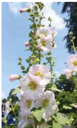
青空とタチアオイ (多摩川住宅八棟)