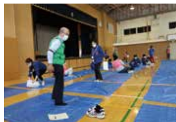
清水校長先生も参加