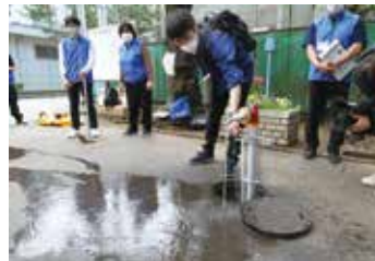
断水時に役立つ応急給水訓練