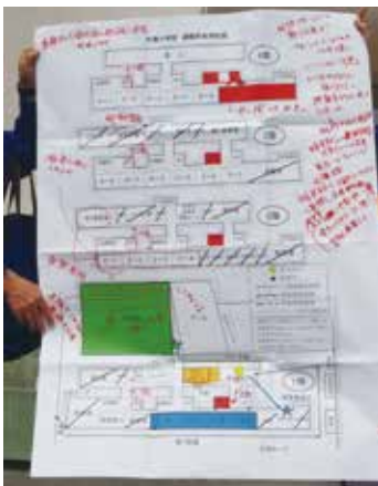
避難所利用計画図を使って