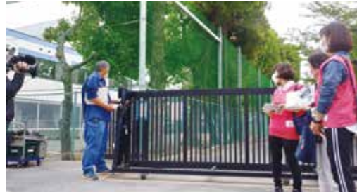
まずは校門の 開け方から