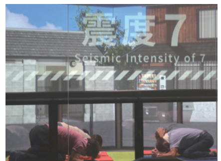
▲地震体験コーナー