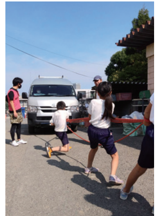
重量物移動訓練～滑車の原理で重い物を軽く動かす