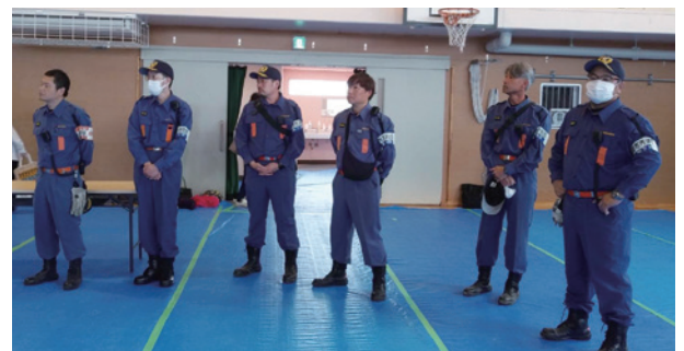
第7分団の皆さま～いつもお世話になります

【協力】 調布消防署国領出張所、調布市消防団第7分団、防火女性の会、NPO法人災害救難活動、杉森地区連合会、健全育成推進杉森地区委員会、杉森小学校開放委員会、杉森小学校PTA、は棟管理組合、八八倶楽部、杉風、民生委員、地域コーディネーターの皆さま