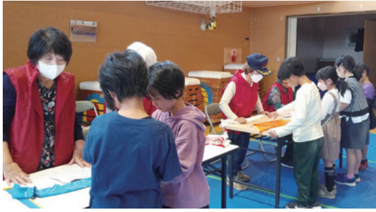
応急手当訓練～バンダナを使ってケガの手当