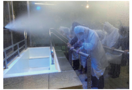
▲暴風雨体験コーナー

〒130-0003 東京都墨田区横川4丁目6-6 午前9時～午後5時(入館受付 午後4時30分まで) ▶休館日 毎週水曜日・第3木曜日 年末年始(12月29日～1月3日) ▶入館料 無料