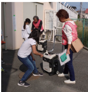
ガスパワー発電機体験～カセットガスボンベ2本+エンジンオイルで発電OK