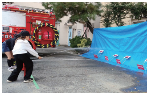
初期消火訓練～消火器の操作手順が大事