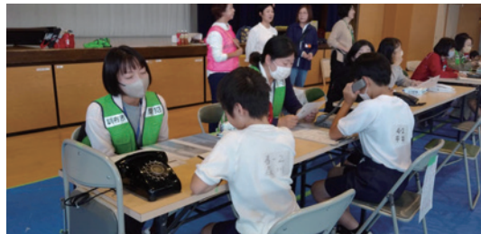
通報訓練～自分の住所・火事の場所、正しく伝える