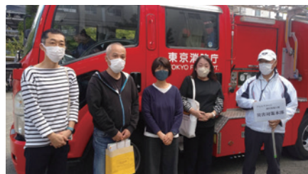
フォルスコート防災会の皆さま

【協力】 調布消防署国領出張所、調布市消防団第7分団、防火女性の会、NPO法人災害救難活動、杉森地区連合会、健全育成推進杉森地区委員会、杉森小学校開放委員会、杉森小学校PTA、は棟管理組合、八八倶楽部、杉風、民生委員、地域コーディネーターの皆さま