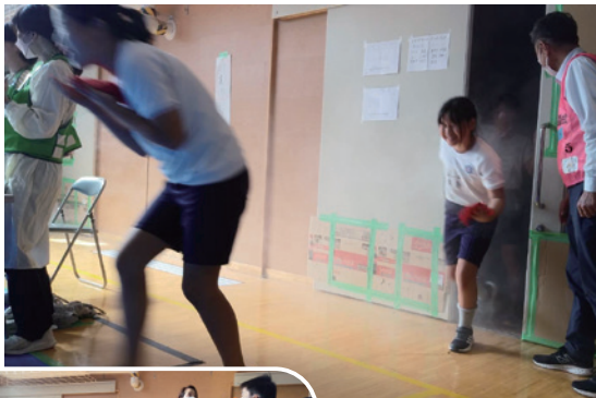
煙体験～模擬煙はバニラ臭、だけど息苦しい！