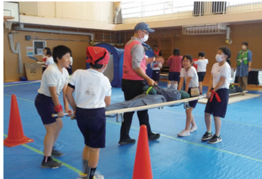
担架搬送訓練～4人で力を合わせて運ぶ