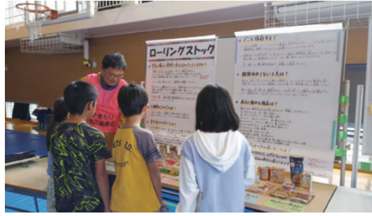
ローリングストック展示～見て聞いて考えて備える