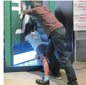
◀都市型水害コーナー