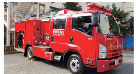
調布消防署国領出張所の皆さま、ご協力ありがとうございました