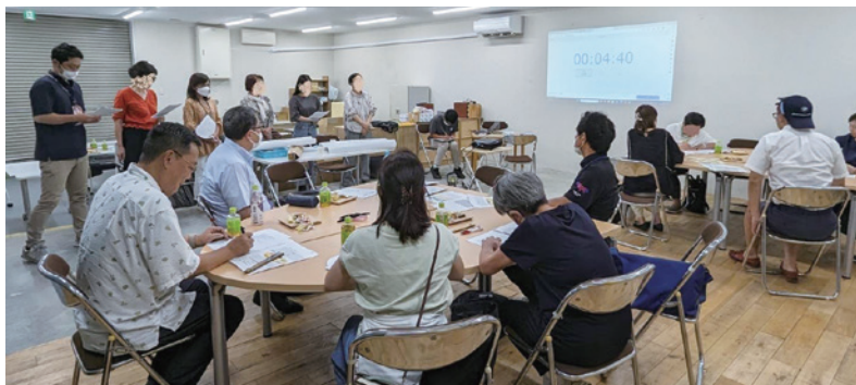
策定委員会の様子

●「地域福祉活動計画」とは、地域福祉の考え方を実現するために、住民一人ひとりが地域の生活課題を自分たちの問題として捉え、その課題の解決を図るために、地域で取り組むことを具体的にまとめた行動計画です。