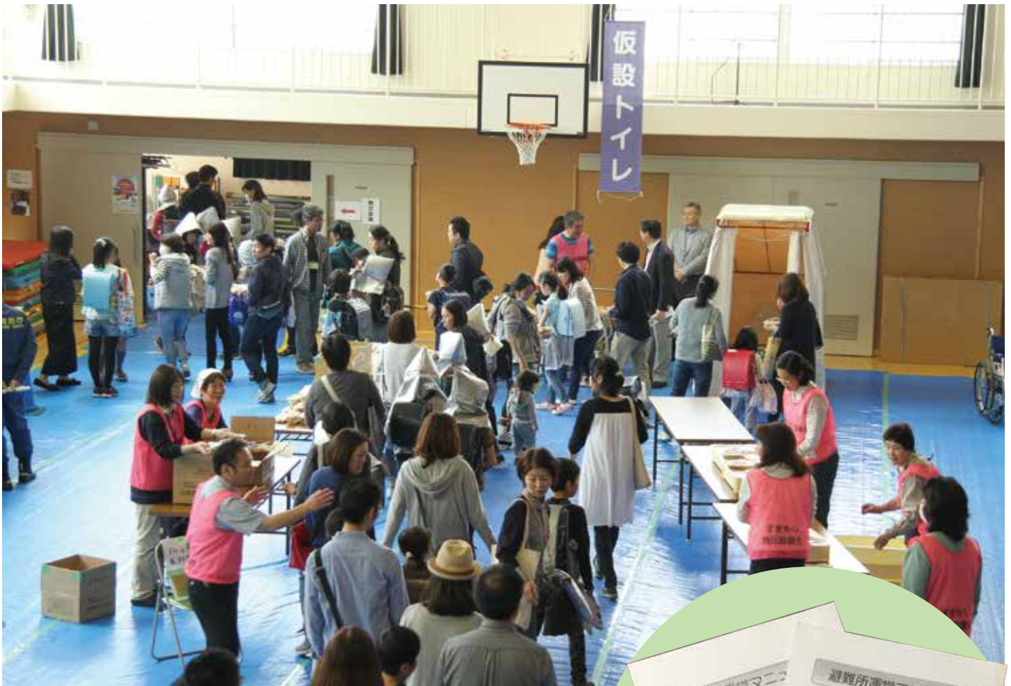
4月23日防災教育の日