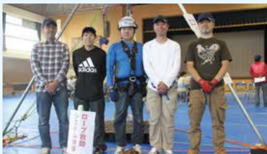
NPO法人 災害救難活動のみなさん