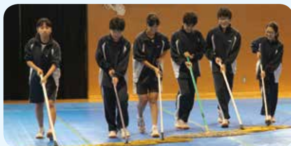
三中生徒会のみなさん