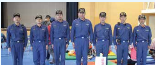
調布消防署 国領出張所のみなさん